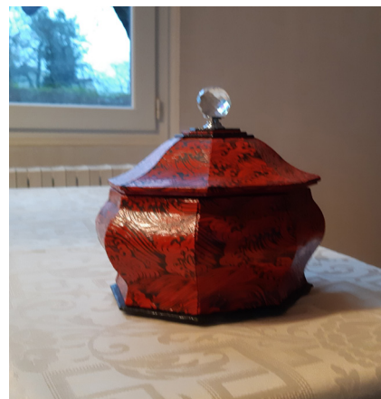
Boîte réalisée par les dentellières pratiquant également le cartonnage.