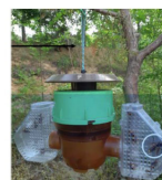
Piège coréen à ailes Environ 45 €