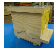
Piège à grilles Néoppi jaunes Environ 30 €