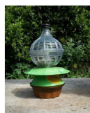
Piège japonais Environ 75 €